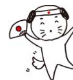
ステッカーイメージ図