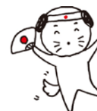
ステッカーイメージ図