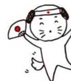
ステッカーイメージ図